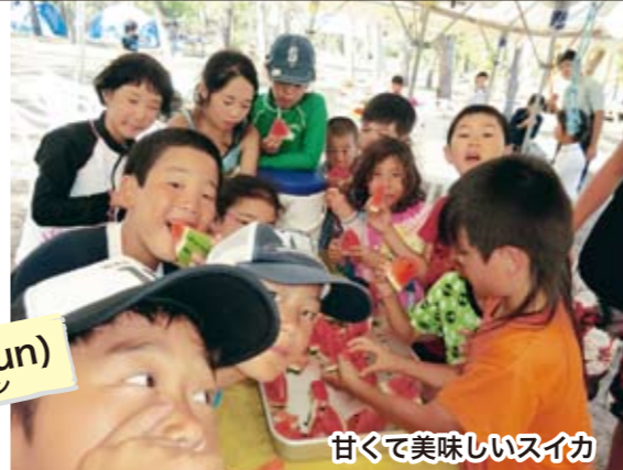
甘くて美味しいスイカ