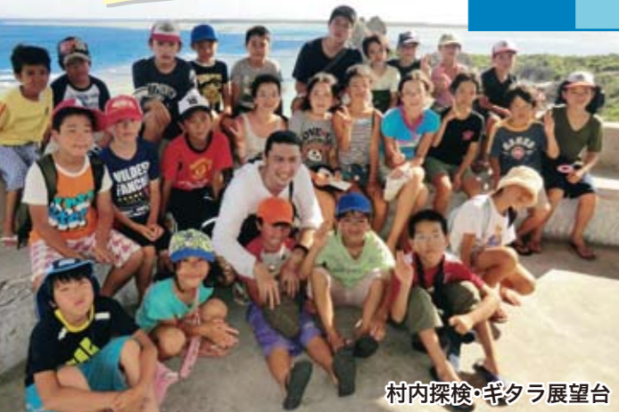
村内探検・ギタラ展望台